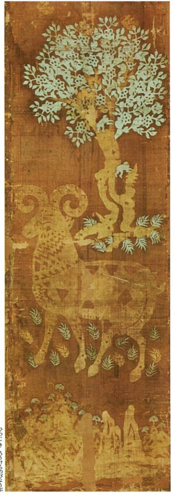
ひつじまきうけのびんぼう 羊木鴈縷屏風