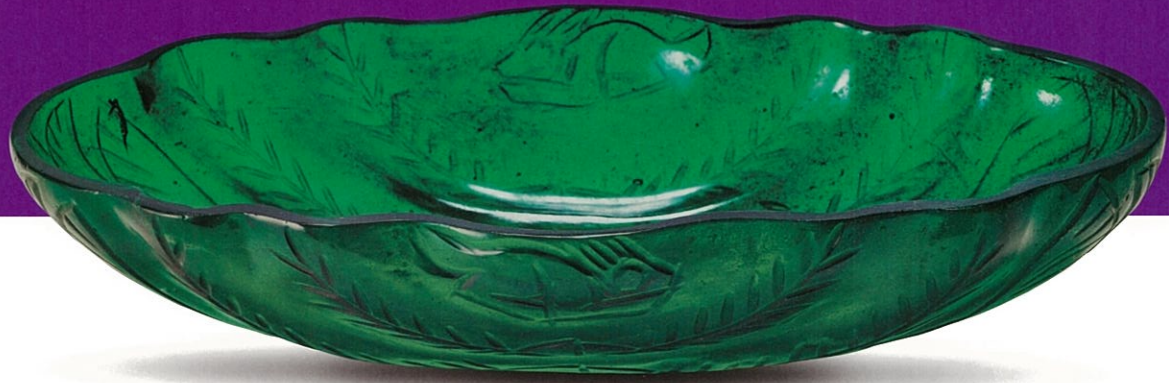
みどりるりのじゆに きょくちやうはい 緑瑠璃十二曲長坏

The 69th Annual Exhibition of Shōsō-in Treasures