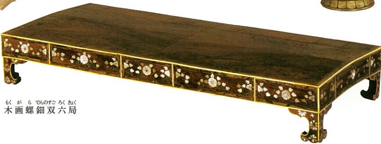
まがらでんのすくくく 木画螺鈿双六局