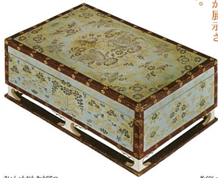
へきじ きんぎん えのはこ 碧地金銀絵箱

10件)が展示さ れます。 はじめ58件の宝物(うち初出陳 長細い注ぎ口の水差し「金銅水瓶」 十二曲長坏」、鳥の頭をかたどった ある緑色のガラス製の器「緑瑠璃 「羊木鴈縷屏風」、ウサギの文様が る大理石製の尺八「玉尺八」や、ペ ルシャ風の巻き角の羊が表された 今年、聖武天皇にゆかりのあ 約9000件にのぼります。