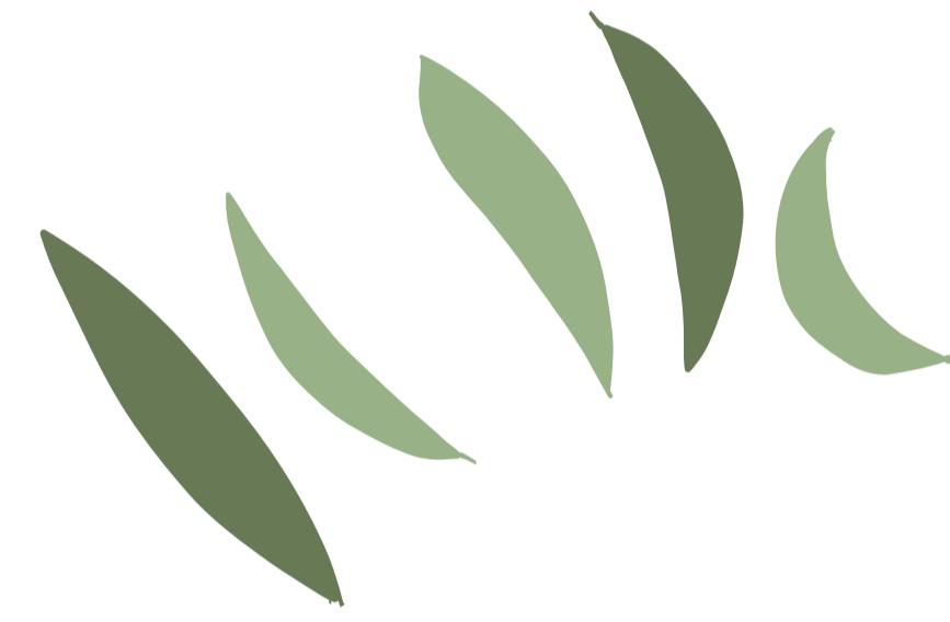
5種類の形をした葉